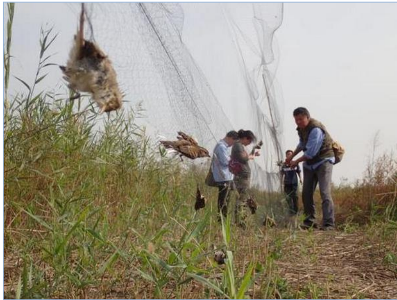
（志愿者正在拆除鸟网）

国庆期间，护鸟志愿者在天津、唐山发现两大片非法捕鸟区域，累计拆除两万余米，解救活鸟近 3000 只，挂网死鸟 5000 余只。其中不乏国家重点保护野生动物。目前，警方已抓获一名涉案嫌疑人。国家林业局紧急派出督导组，前往上述地区对打击乱捕滥猎和非法经营鸟类活动等野生动物保护工作进行现场督导。