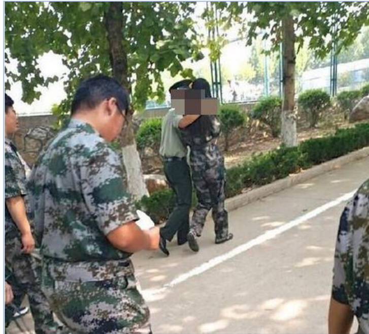
（教官与女学生当众亲昵）

近日，一组高校军训教官向大一女生表白的图片在网上热传，并引发广泛争议。据悉，该事件发生在位于临沂市费县的青岛理工大学，事件的男女主角分别为大一女新生和军训教官。随后，校方发出一份情况说明称军队和学校方面对此高度重视，军队和学校方面已经展开调查。