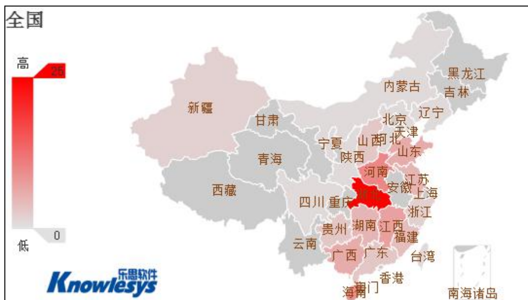
(图5：“湖北恩施校服腐败案”地域舆情分布图 单位：篇)