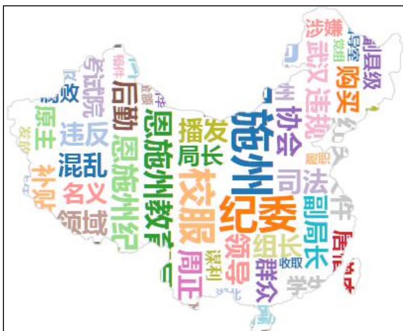
(图4：“湖北恩施校服腐败案”词云图)