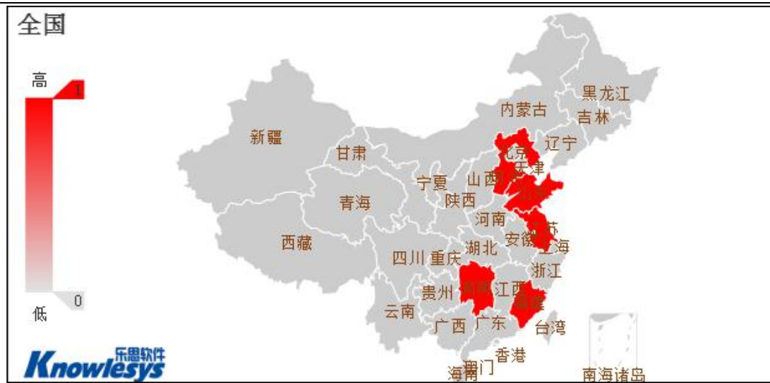
(图 3: “北京奥运会中国三举重冠军涉兴奋剂”地域舆情分布图 单位: 篇)