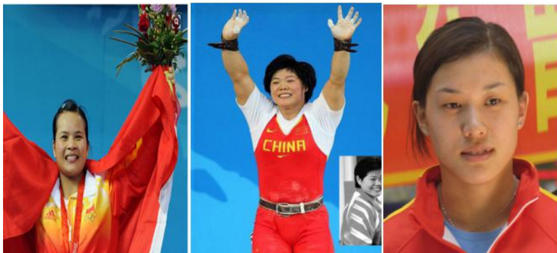
(图1：中国涉事举重运动员从左到右：陈燮霞、刘春红、曹磊)

8月24日，国际奥委会对2008年北京奥运会运动员检验样本重新检测，经检测，包括3名中国选手在内的，15名运动员药检结果呈阳性，涉事的运动员被处于临时禁赛的处罚。2008年北京奥运会举重比赛上的3名中国金牌获得者(刘春红、陈燮霞、曹磊)，以及2名俄罗斯铜牌获得者(德米特里·拉皮科夫、哈吉穆拉特·阿卡耶夫)，因药检结果呈阳性而被禁。除了中国和俄罗斯，还有来自阿塞拜疆、白俄罗斯、乌克兰和哈萨克斯坦等国的运动员。目前，这些运动员已经处于禁赛接受检查的状态，具体结果还需要进一步调查。