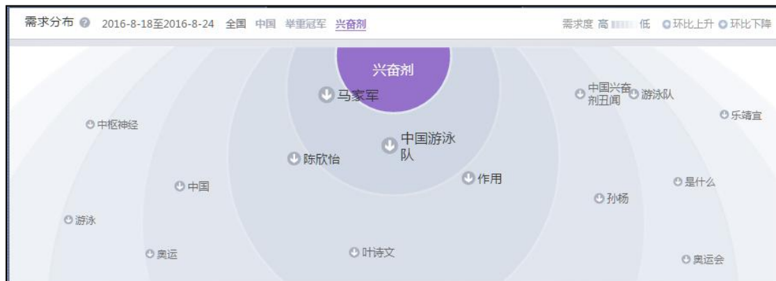
(图 4: “北京奥运会中国三举重冠军涉兴奋剂”需求分布图 数据来源: 360 指数)

对于“北京奥运会中国三举重冠军涉兴奋剂”的新闻，搜索其关键词“兴奋剂”，在 360 指数上得到图 4 数据。与关键词“兴奋剂”最靠近的是“马家军”，这是辽宁省田径队女子中长跑组训练的一批女子中长跑运动员，在 1997 年陷入了兴奋剂风波，名誉大损。其次是“中国游泳队”陈欣怡的兴奋剂事件，也使得中国水军此番在里约经历了毁灭性的打