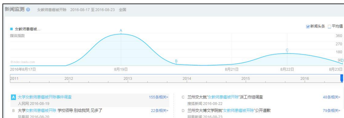
（图 4：“兰州高校女教师患癌被开除”新闻头条监测图）