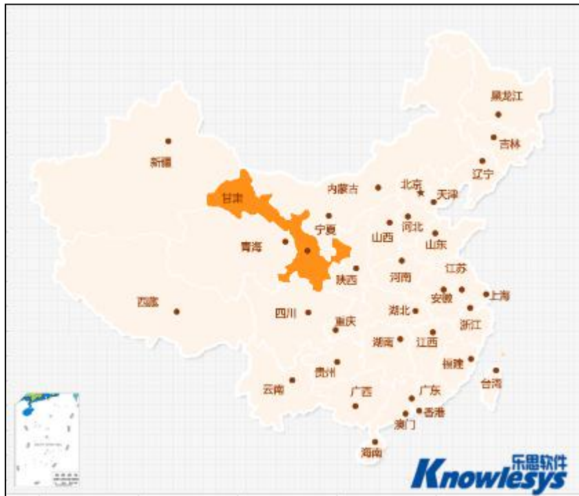
（图 3：“兰州高校女教师患癌被开除”地域舆情分布图 单位：篇）

从地域舆情分布图可见，事发地甘肃地域舆情呈橙色高亮显示，成为了此次“兰州高校女教师患癌被开除”事件的舆论主场。